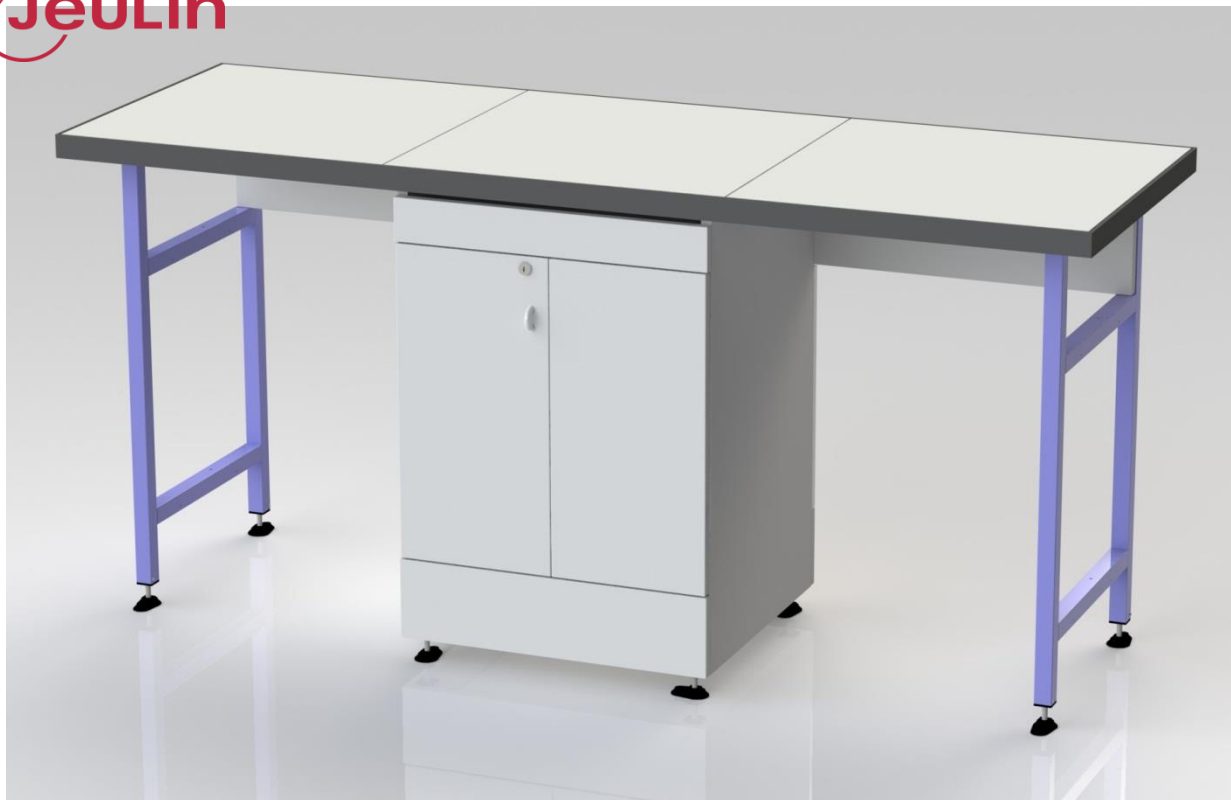
Exemple de placard sous paillasse de 1m80